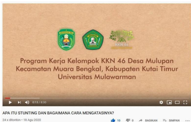
Gambar 3. tautan video di Youtube tentang program kerja KKN KLB di Desa Mulupan

Dalam pelaksanaan program kerja kelompok yang telah dibuat selanjutnya diupload ke Instagram KKN Lurah Anabanua dapat di akses di Link Instagram: