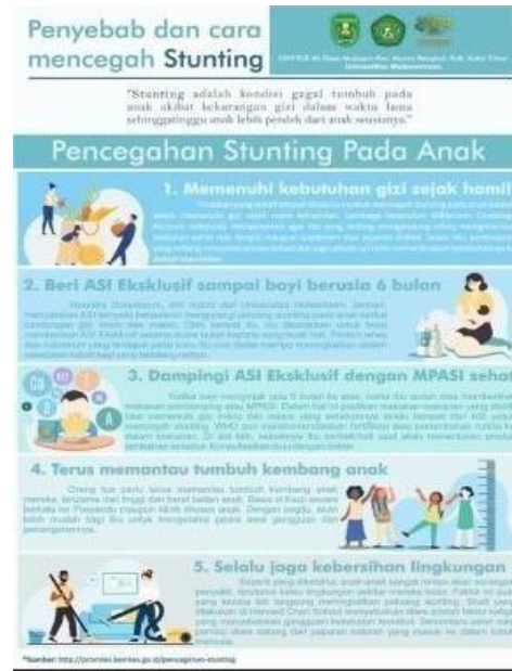
Gambar 2. Naskah video stunting dan poster stunting

Dalam pelaksanaan program kerja kelompok yang telah dibuat selanjutnya diupload ke Instagram KKN Lurah Anabanua dapat di akses di Link Instagram: