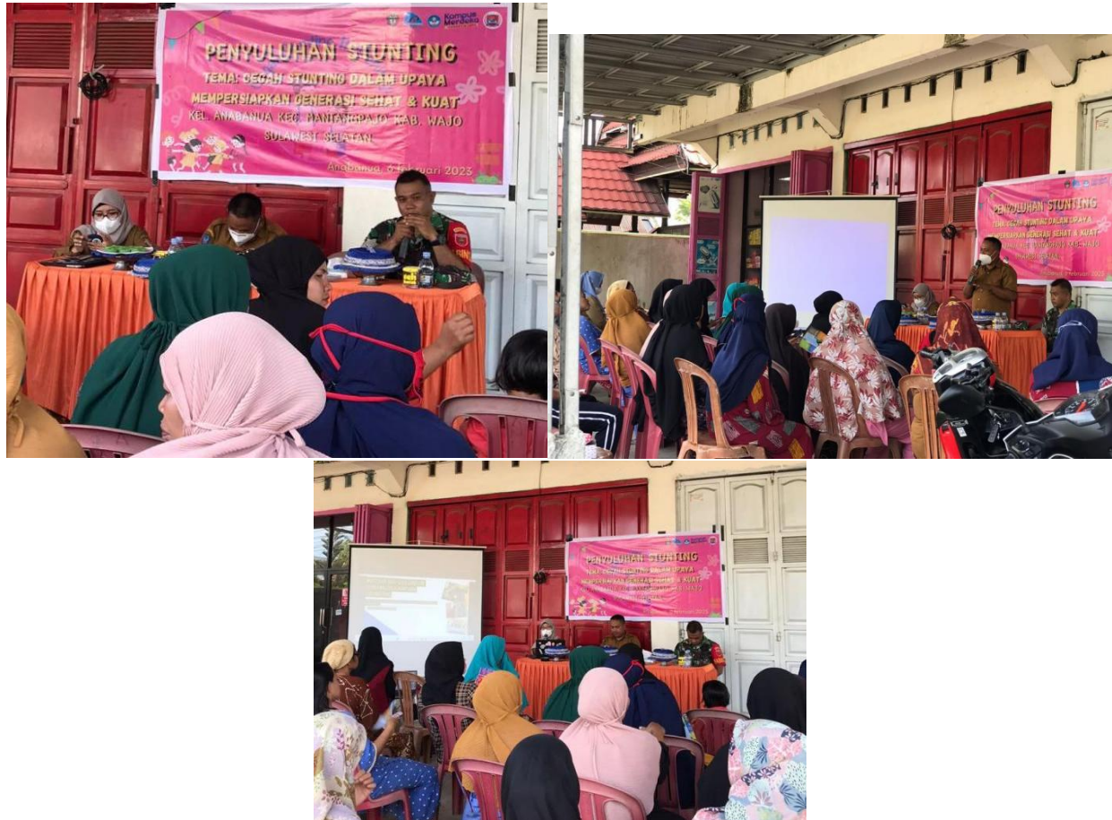
Gambar 1. Diskusi dengan Pendamping Lapangan Desa