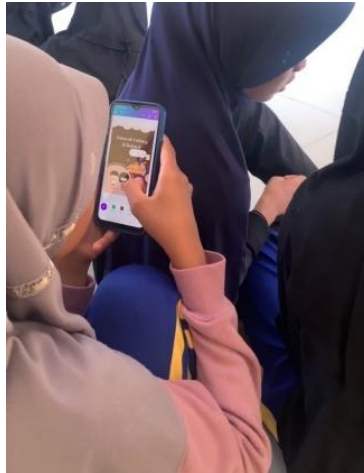
Gambar 2. Proses Mendesain Poster