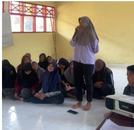
Gambar 3. Sesi Tanya Jawab