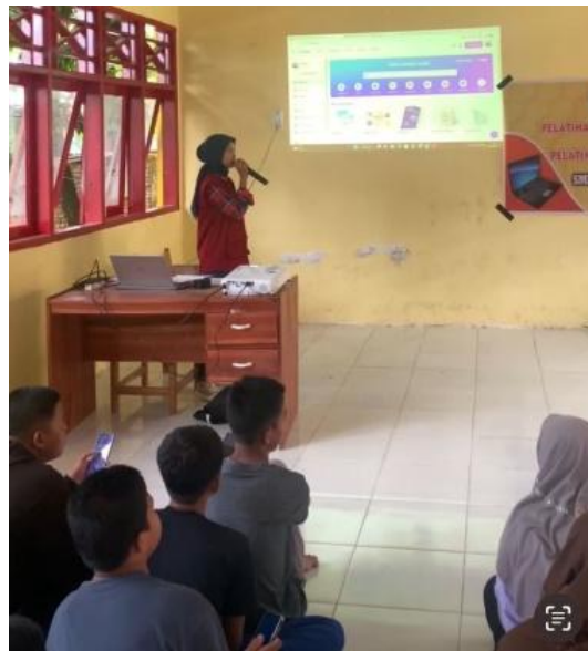
Gambar 1. Pengenalan Aplikasi Canva