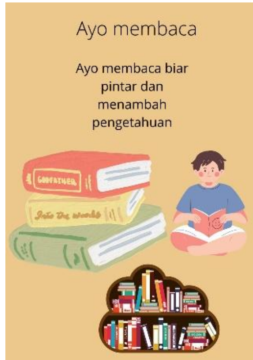
Gambar 4. Hasil Karya Siswa